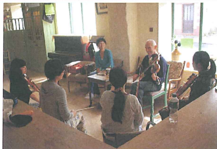
写真はブラックバードミュージック主催、2014年フィークルアイリッシュミュージックキャンプの様子

お申し込み方法:①お名前②参加する楽器③メールアドレス(PCからのメールが受信可能なアドレスをお願いいたします)④緊急時ご連絡用電話番号、以上4点をご明記の上、下記のアドレスにEメールにてお申し込みください。